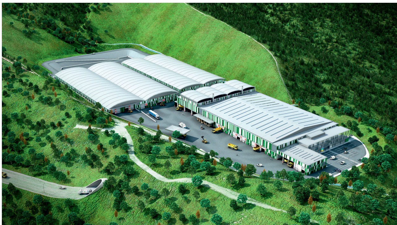
Zubietako TMB planta

Hortik aurrera zer? Europar Batasunak markatzen du bere hierarkiarekin eta Ekonomia Zirkularraren irizpideekin nola hobetu behar den hondakinen aprobetxamendua, berrerabilpena, birziklatzea eta murrizketa sustatuz. Europan badira dagoeneko martxan Gipuzkoa adinako eskualde handiak (Italiako Treviso...) 50 kg errefusetik zortzi urteko epean 10 kgtara murrizteko lanean ari direnak. Lurrez eta lehengaiz oso urri dabilen eta dagoeneko kutsaduraz gainezka dagoen Gipuzkoak puntako eskualdeekin elkarlanean aritu behar du.